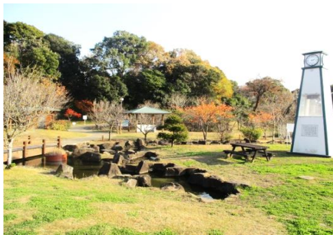
▶佐布里緑と花のふれあい公園 (梅っ花そり)

佐布里地区のうち、梅が丘が一番高齢化が進んでいるので、対策を進めていきたいです。佐布里地区の魅力が伝わり、より活発な地域になるといいなと感じています。