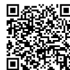
【会場への交通案内】