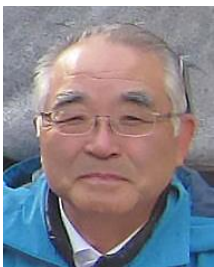
【講師・コーディネーター】 日本気象予報士会東海支部長 日本気象学会中部支部 理事