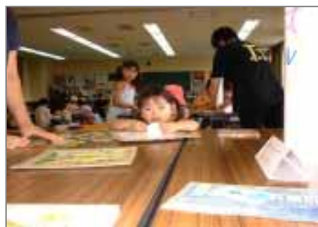
【としょかんまつり】 平成16年7月17日

をもとに大型紙芝居、パネルシアター、ペープサートなど自分たちで制作したものもたくさんあります。活動は50人の会員が地域別に3つのグループに分かれて行っています。作品はグループごとに制作し、貸し出しもしています。