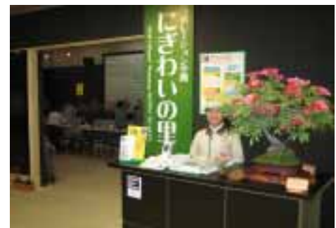
【「手作りリボン盆栽」(5/18)の様子】

「愛知エコ・コミュニティ活動紹介」のコーナーでは、絵本づくりや押し花づくりなどが体験できるワークショップや様々な環境活動やムーブメントの発表などが日替わりで行われています。集まれ！エコの仲間たち“みんなが主役”のコーナーにぜひお越しください。なお、瀬戸愛知県館の団体予約や「にぎわいの里」の詳しいスケジュール等は右記の公式ウェブサイトをご覧ください。