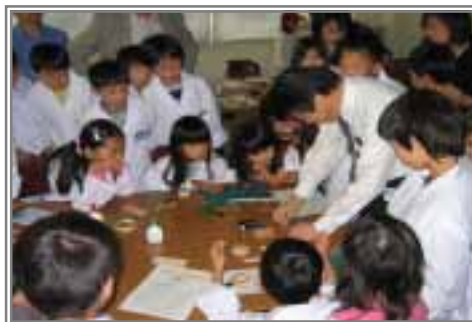
【中部大学科学たんてい団】

講座内容の詳細に関しては、「学びネットあいち」や「中部大学ホームページ」に掲載しております。