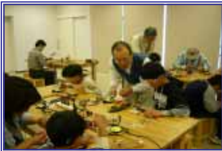
【ゆめホタルワークショップ】