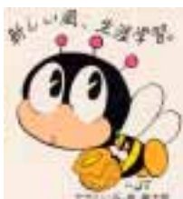
生涯学習のマスコット“マナビ”

ゆめたろうプラザは、平成16年9月にオープンした輝きホール(678席)と響きホール(最大270席)の大小2つのホールと練習室、スタジオ、ミーティングルーム、情報考房、創作工房、和室、ギャラリー、情報ラウンジ、喫茶コーナーなどを有する複合総合文化施設です。