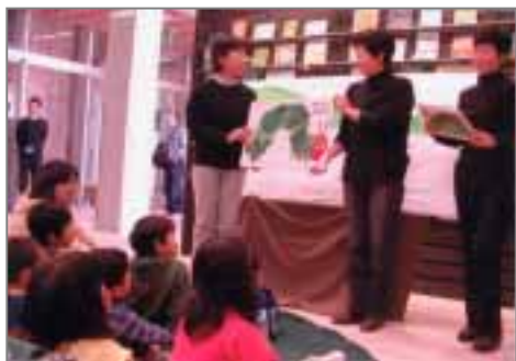
【愛知万博会場での読み聞かせ】 平成17年4月3日