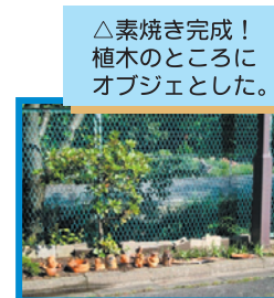
△素焼き完成！植木のところにオブジェとした。