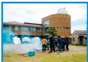
△希望の家の外観（素焼き中）

会場は岩倉市希望の家。近くには五条川が流れ田畑に囲まれた静かな場所だ。宿泊もできる施設なので子ども会やスポーツ団体のキャンプ等で利用されている。