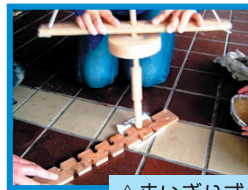
△まいぎり式の火おこし器

おこし器」で種火作り。これが大変な苦勞だった。マッチやライターを使えば簡単に火はつくが、この作業がまさに体験活動だ。