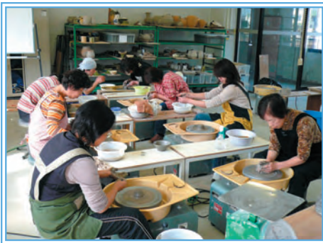
▲「作ってみよう！やきもの」

また、美術・デザイン系では、毎年人気のある水彩画や吹きガラス、木彫に加え、銅版画、テラコッタ、木枠で作る織物の講座を新設します。ほかにもコンピュータグラフィックや西洋絵画の鑑賞、創作折紙、陶芸など、皆様の幅広いニーズにお応えできるよう、多彩なジャンルの内容をご用意しております。すべての講座が初心者から受講可能で、各受講者の進度やご要望に合わせて、講師がきめ細かく指導いたします。