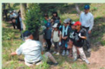
親子ササユリ観察会

シニアの有志で始めたササユリの保護活動を継続するなかで、小学生の親子への活動紹介や中学生への保護活動参加を呼びかけて、住民協働の地域活動へと発展させています。