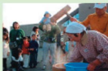
三世代もちつき大会

地域のシニア世代で仲間をつくり、自ら内容を決めて学び、その成果を子どもたちに伝える活動をしています。子どもたちとふれあいながら、楽しく交流を深めています。