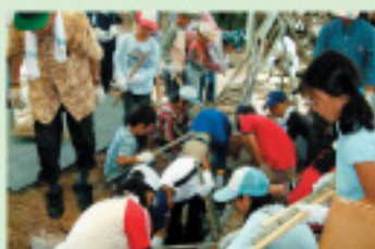
シニアから竹炭づくりを学ぶ

地域のシニア世代が「炭焼き」を学び、竹炭づくりから地域を流れる川の浄化活動へとつなげ、子どもや親世代を巻き込んだ自然環境保全活動を行いました。