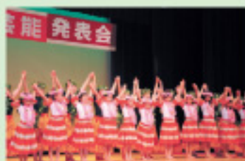
フラダンス教室発表会

町の文化協会を中心に、シニア世代が講師となり、子ども向けの講座を開催しています。子どもたちに様々な体験の機会とふれあいの場を提供し、同時に子どもたちから元気もらっています。