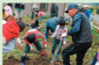
シニアと子どもと親の協力が自然に生まれた いも堀り

遊休地を使った「さつまいもづくり」をきっかけに、シニアの皆さんが持つ経験や技を伝える、親子対象のさまざまな体験学習が開催されています。活動を媒介として、子と親とシニア世代がかかわる活動が活発に行われるようになりました。