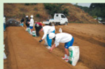
ササユリの球根移植

シニアの有志で始めたササユリの保護活動を継続するなかで、小学生の親子への活動紹介や中学生への保護活動参加を呼びかけて、住民協働の地域活動へと発展させています。