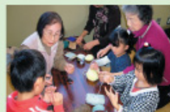
指編みのマフラーを作ろう

地域のシニア世代で仲間をつくり、自ら内容を決めて学び、その成果を子どもたちに伝える活動をしています。子どもたちとふれあいながら、楽しく交流を深めています。