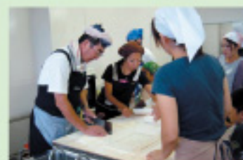
うどんづくり教室では、シニアの腕前に感心

遊休地を使った「さつまいもづくり」をきっかけに、シニアの皆さんが持つ経験や技を伝える、親子対象のさまざまな体験学習が開催されています。活動を媒介として、子と親とシニア世代がかかわる活動が活発に行われるようになりました。