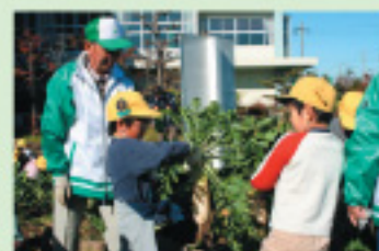
春日町特産の宮重大根の収穫

町の文化協会を中心に、シニア世代が講師となり、子ども向けの講座を開催しています。子どもたちに様々な体験の機会とふれあいの場を提供し、同時に子どもたちから元気もらっています。