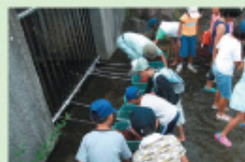
川の浄化のために竹炭を設置中

地域のシニア世代が「炭焼き」を学び、竹炭づくりから地域を流れる川の浄化活動へとつなげ、子どもや親世代を巻き込んだ自然環境保全活動を行いました。