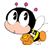
生涯学習マスコット“マナビィ”