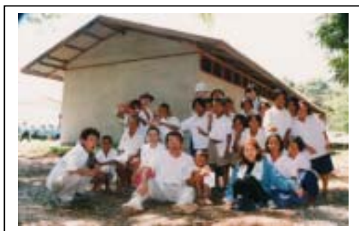
2001年9月 タイ スリン県 WCにて 子供達と建設校舎前で日本のメンバーと共に

また、建設プログラムは東北地域の小中学校の劣悪な教育環境に必要な施設・設備を整備することによって改善するために行われています。具体的には教室不足の学校の教室増設、雨季に通学不可能となる生徒のための学寮、図書室の整備などです。また、この建設作業を手伝うためのワークキャンプを毎年7月から8月にかけて実施しています。一般公募したボランティアが直接現地に行き、現地の人々との共同作業で行われます。毎年3月にボランティアを募集し、学生から退職者まで幅広い年齢層の方が参加しています。ただ建設作業を手伝うというのではなく、現地の人々と直接にふれあい、直に現地の生活を感じる「交流」も目的の一つです。こうした活動でおよそ40の学校で校舎を建設し、200以上の教室を整備できました。