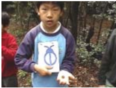
『知多半島グリーンマップ・フィールドワークの様子』 (2003/4/26)