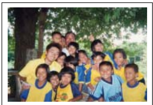
2002年8月 タイ サケオ県 WCにて バンライサムシ - 学校の子供達と 日本人ボランティアスタッフと子供達

明るい未来に向かう子どもたちに大切な教育の機会がもてるように、続けていくと共に、多くの方のご理解を得られることを願っております。