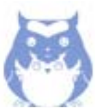
いきいきあいちっ子キャンペーン イメージマーク

編集・発行 / 愛知県教育委員会生涯学習課 生涯学習推進センター 平成16年3月 10,000部発行 〒460-0001 名古屋市中区三の丸三丁目2番1号 電話 052-961-5333