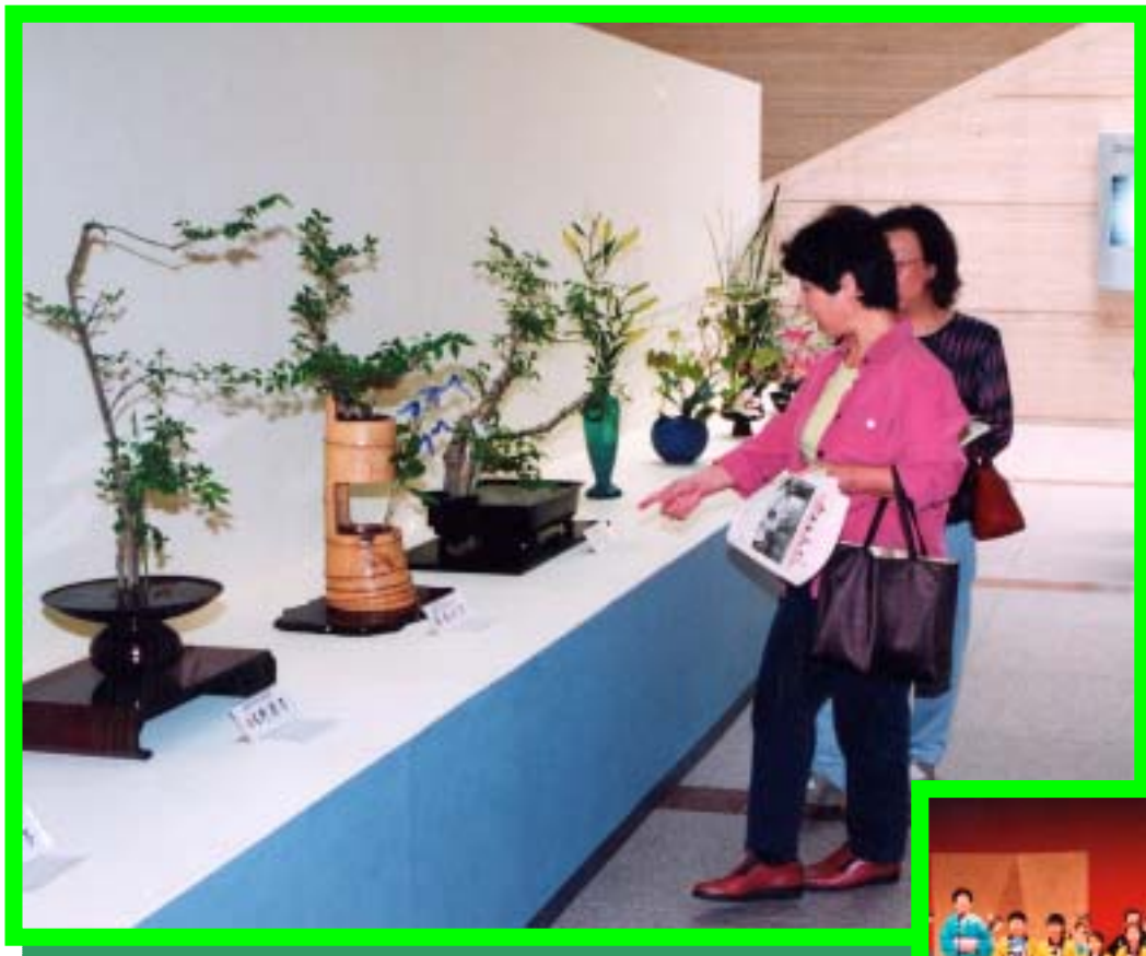
【三好町春の文化展展示作品発表】

TEL 052-961-5333 FAX 052-961-0232 URL http://www.pref.aichi.jp/kyoiku/shogai/llcenter/