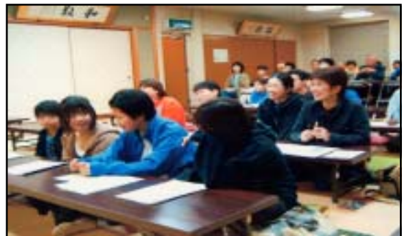
【公開講座受講の様子】

中部2館、東部1館、西部4館、南部2館、北部4館が担当し、市民文化講座等の中央講座と共に、生涯学習の基幹講座として位置づけます。家庭教育、健康・安全等をはじめ、地域のニーズにあった講座内容として、住民の学習の場とします。この講座には、地区の各館長も出席し研修と情報交換を行います。