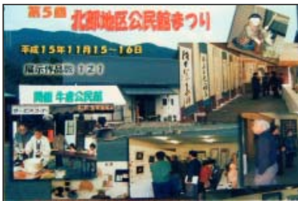
【公民館まつりの様子】

中東部・西部・北部・南部の4つの地区で地区内の公民館活動(生涯学習活動)の発表の場として作品展示し、新城げんきフェスティバルの一環として実施しています。