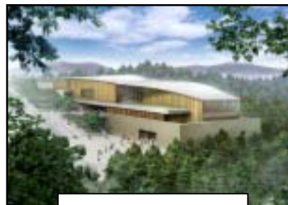
瀬戸会場県パビリオン

うち、4つのプロジェクトに関して次のとおり募集を行います。あなたのアイデアや作品を愛知万博で発表してみませんか?たくさんのご応募お待ちしております。