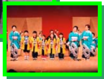
【三好町生涯学習発表会芸能発表】