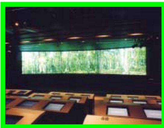
【バーチャルスタジオ】

名古屋市環境学習センターエコパルなごやは、身近な環境から地球環境まで、楽しみながら幅広い視野で環境問題を考え、取り組んでいくための第一歩となる環境学習の拠点施設として平成7年12月、伏見ライフプラザ13階に設立しました。