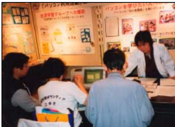
平成14年度「生涯学習のつどい」 小牧市公民館にて

「NPO設立は時期尚早だろうか?」「学習相談こそ本来の活動なのでは?」という意見も出始めた昨今、名古屋市生涯学習センターの訪問、岐阜県可児市の学習相談の見学なども実施し、更に研鑽を積みながら市民の皆さんの生涯学習活動への参画と内容充実に向けて意欲を燃やしています。