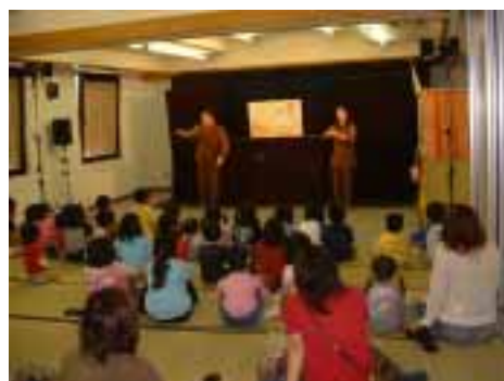
【親子ふれあい劇場 4月29日開催】

また、秋には足助地域文化協会と連携を図り、『足助文化祭』として、芸能発表会や作品展を計画していきます。