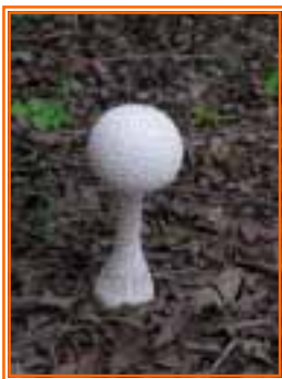
【珍しいきのこ「シロオニタケ」】