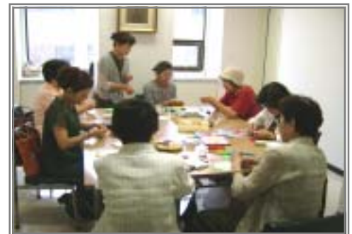
【四季の企画展・ハーブ体験コーナーにて】

また昨年6月からは、県生涯学習推進センター主催の「四季の企画展」に、和太鼓、計算トライアスロン、ハーブ、きり絵、木彫り、書、写真などを出展しています。