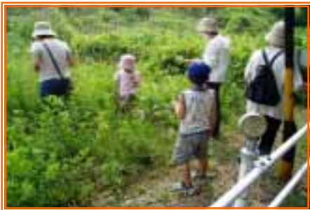
【きのこの観察会の様子】