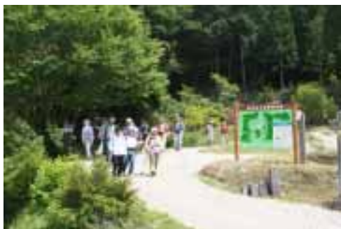
【5月開催 あすけウォーク「正三みちロマンコース」】

あすけウォーク2005『正三 しょうさん みちロマンコース』と題し、本年度は、郷土の偉人「鈴木正三」没後350年記念事業として、歴史探訪ウォーキングを5月に開催しました。体育指導委員や地元自治区の方々のご協力により、市内外から213名の参加者は、あらためて地域の歴史・生い立ち等の魅力を再発見し、地域づくりへの意欲も高揚いたしました。秋には「山里あすけ体育祭」、冬には「まちなみマラソン大会」を予定しています。